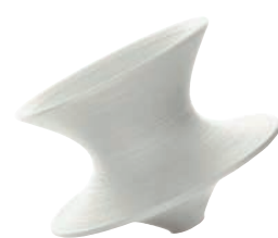
Matt colour White 1735 C