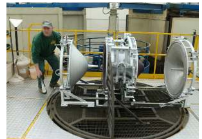
Processus de production