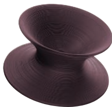
Matt colour Dark Purple 1133 C