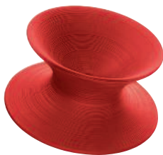
Matt colour Red 1004 C