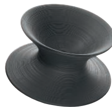
Matt colour Grey Anthracite 1428 C