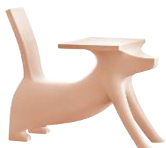
Matt colour Pink 1628 C