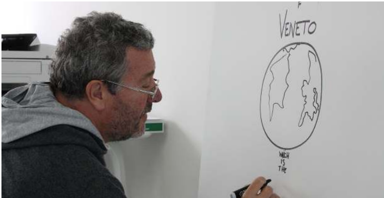
Designer chez Magis

Le Chien Savant s'est mis en tête de faire de tous les enfants des savants à son image. Quel dommage qu'il n'y ait pas un chien comme ça pour les grands !