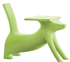
Matt colour Green 1315 C