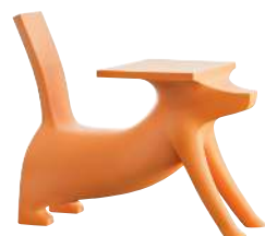
Matt colour Orange 1647 C