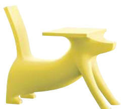
Matt colour Yellow 1569 C