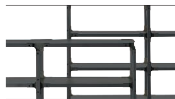
Frame: Beech painted Black Joints + Top: Black 8510