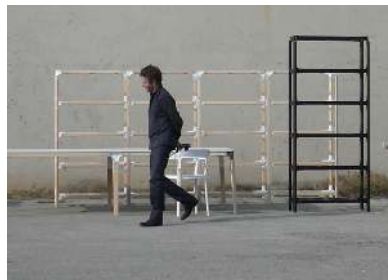
Designers chez Magis