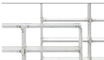
Frame: Beech painted White Joints + Top: White 8500