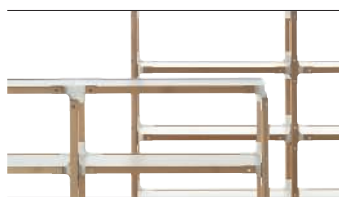
Frame: Natural Beech Joints + Top: White 8500