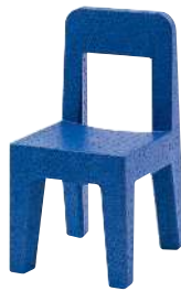
Matt colour Blue 1606 C