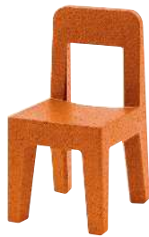
Matt colour Orange 1082 C