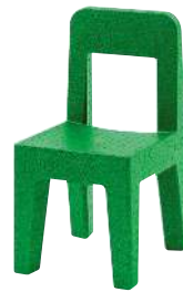
Matt colour Green 1638 C