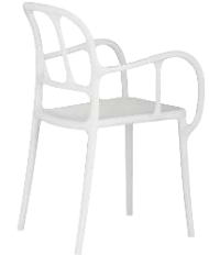
Matt colour White 1738 C