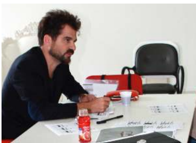
Designer chez Magis