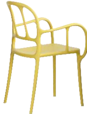
Matt colour Yellow 1666 C