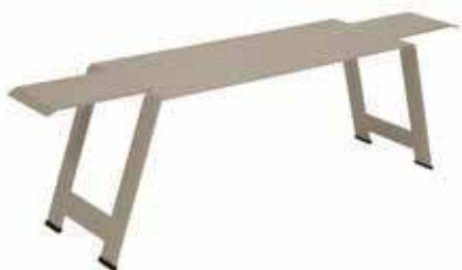
1015 - LE BANC Banc tôle acier 8 mm