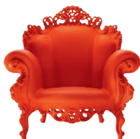
Matt color Red 1114 C