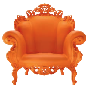
Matt color Orange 1087 C