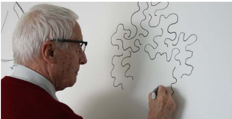
Designer chez Magis