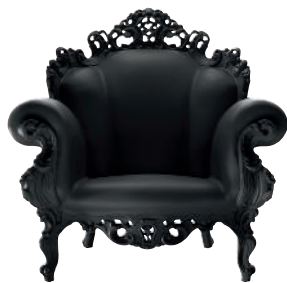
Matt color Black 1754 C