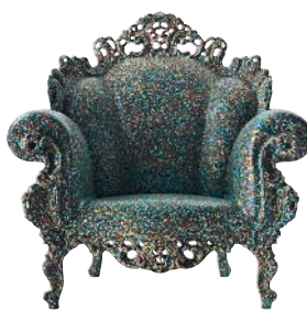
Matt color Multicolor