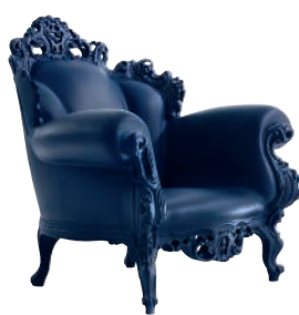
Matt color Blue 1192 C