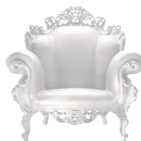
Matt color White 1735 C